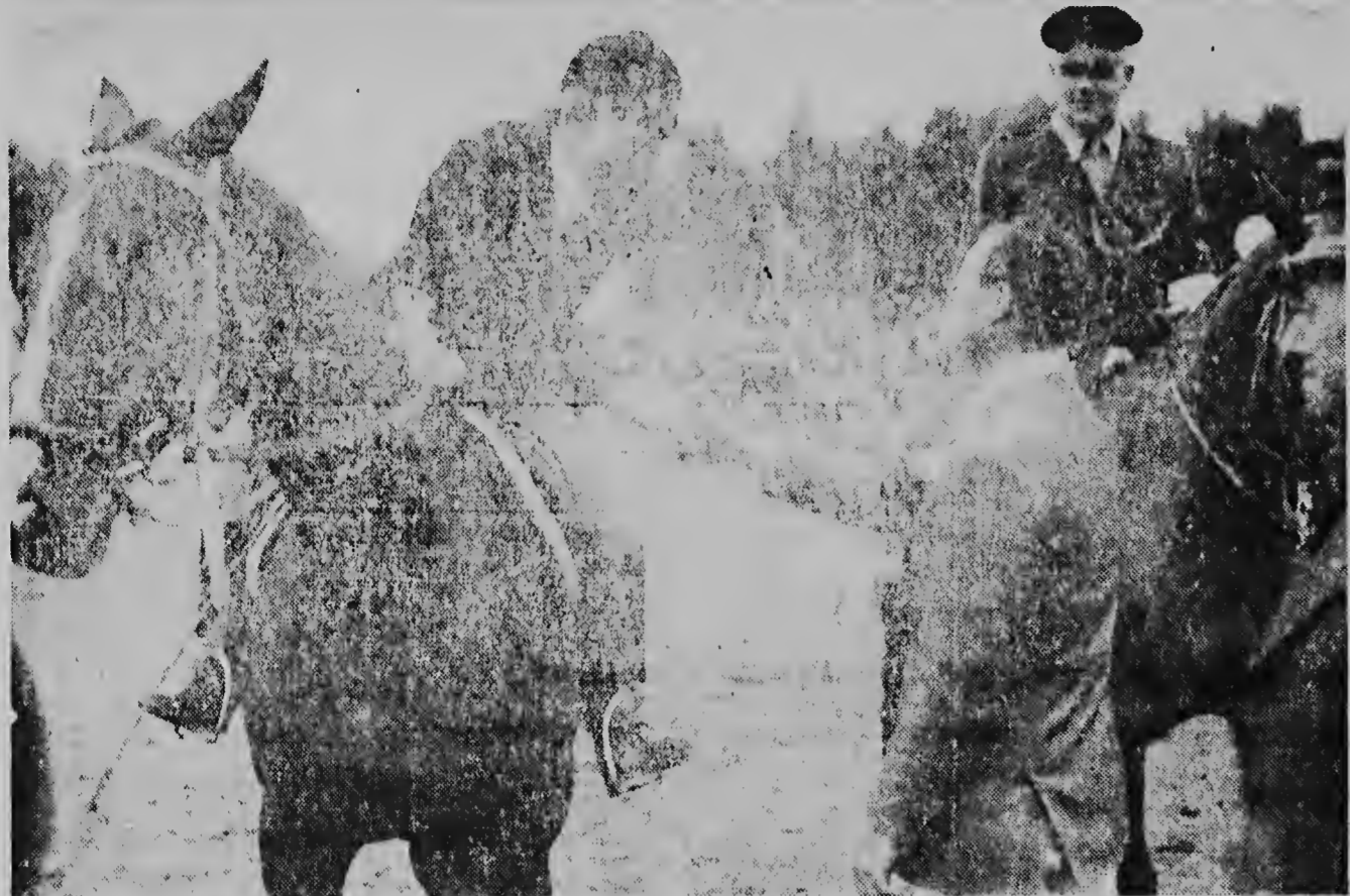
E portret aki a worde saca na anja 1957, tempu eue Prinses Beatrix tabata tin diesmehe anja. Durante un „jengdeconcours” di corrementu di calhai ela caba di cosecha un sucesu considerable y naturalmente su tata orgulloso, Prinses Bernhard, tabata esun di promer eue a bin feliciteer e.